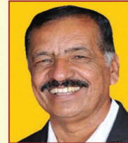
ಶ್ರೀ ಸೀನಿವಾಸನ್ ನಿರ್ದೇಶಕರು