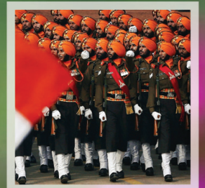
ಜನವರಿ 26, ಗಣರಾಜ್ಯೋತ್ಸವ