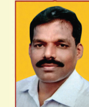
ಶ್ರೀ ಸೀನಿವಾಸನ್ ನಿರ್ದೇಶಕರು