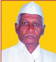
ಶ್ರೀ ಸೀನಿವಾಸನ್ ನಿರ್ದೇಶಕರು