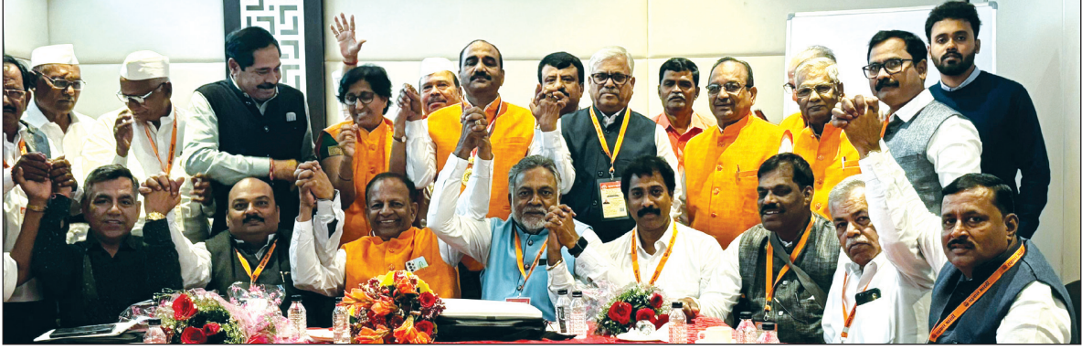
ನವದೆಹಲಿಯಲ್ಲಿ ಡಿಸೆಂಬರ್‌ನಲ್ಲಿ ನಡೆದ ಪತ್ತಿನ ಸಹಕಾರ ಸಂಘಗಳ ಸಮಾವೇಶದಲ್ಲಿ ಕರ್ನಾಟಕ ರಾಜ್ಯದ ಪತ್ತಿನ ಸಹಕಾರ ಸಂಘಗಳ ಮಹಾಮಂಡಳದ ಅಧ್ಯಕ್ಷರು, ಉಪಾಧ್ಯಕ್ಷರು ಹಾಗೂ ಆಡಳಿತ ಮಂಡಳಿ ಸದಸ್ಯರುಗಳು ಮಹಾರಾಷ್ಟ್ರ ರಾಜ್ಯದ ಪತ್ತಿನ ಸಹಕಾರ ಸಂಘಗಳ ಮಹಾಮಂಡಳದ ಆಡಳಿತ ಮಂಡಳಿ ಸದಸ್ಯರುಗಳೊಂದಿಗೆ ಪತ್ತಿನ ಸಹಕಾರ ಸಂಘಗಳ ಬೆಳವಣಿಗೆಯ ಕುರಿತು ವಿಚಾರ ವಿನಿಮಯ ನಡೆಸಿದರು.