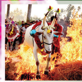
ಜನವರಿ 15, ಸಂಸ್ಕೃತಿ