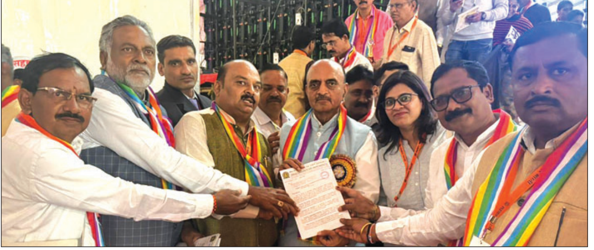
ಪತ್ತಿನ ಸಹಕಾರ ಸಂಘಗಳು ಎದುರಿಸುತ್ತಿರುವ ಸಮಸ್ಯೆಗಳಿಗೆ ಪರಿಹಾರ ಕಲ್ಪಿಸುವಂತೆ ರಾಜ್ಯ ಪತ್ತಿನ ಸಹಕಾರ ಮಹಾಮಂಡಳದ ಪದಾಧಿಕಾರಿಗಳು ಕೇಂದ್ರ ಸಹಾಯಕ ಸಚಿವ ಶ್ರೀ ಕರಾಡ್ ಅವರಿಗೆ ಮನವಿ ಸಲ್ಲಿಸಿದರು.