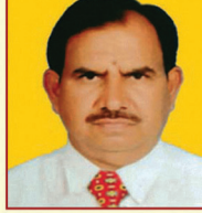
ಶ್ರೀ ಸೀನಿವಾಸನ್ ನಿರ್ದೇಶಕರು