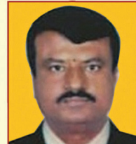
ಶ್ರೀ ಸೀನಿವಾಸನ್ ನಿರ್ದೇಶಕರು