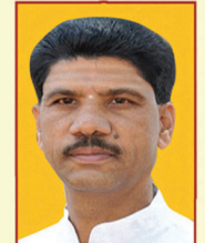
ಶ್ರೀ ಸೀನಿವಾಸನ್ ನಿರ್ದೇಶಕರು