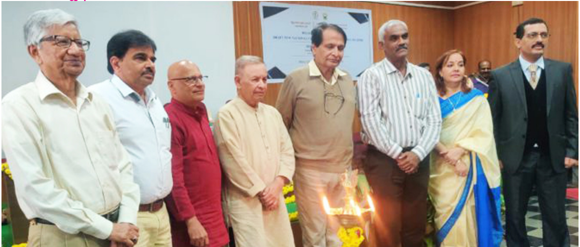
ವರದಿಗೆ 6ನೇ ಪುಟ ನೋಡಿ.....

ರಾಷ್ಟ್ರೀಯ ಸಹಕಾರ ನೀತಿ ಕರಡು ಅಂತಿಮ: ಸುರೇಶ್ ಪ್ರಭು