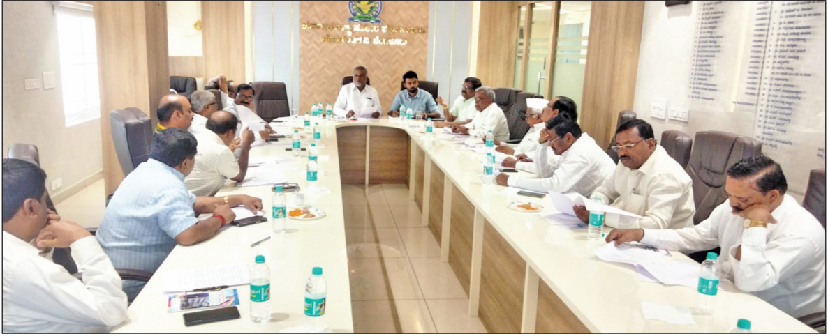
ದಿನಾಂಕ : 27.03.2024ರಂದು ನಡೆದ ಆಡಳಿತ ಮಂಡಳಿ ತುರ್ತು ಸಭೆಯಲ್ಲಿ ಪತ್ತಿನ ಸಹಕಾರ ಸಂಘಗಳಿಗೆ ಸಂಬಂಧಿಸಿದ ಸರ್ಕಾರದ ಆದೇಶವನ್ನು ಹಿಂಪಡೆಯಲು ಕರ್ನಾಟಕ ಉಚ್ಚನ್ಯಾಯಾಲಯದಲ್ಲಿ ಪ್ರಕರಣ ದಾಖಲಿಸಲು ತೀರ್ಮಾನಿಸಲಾಯಿತು. ನಂತರ ಕರ್ನಾಟಕ ಉಚ್ಚನ್ಯಾಯಾಲಯದಲ್ಲಿ ಪತ್ತಿನ ಮಹಾಮಂಡಳವು ಮನವಿ ಸಲ್ಲಿಸಿದೆ.

ಸೌಲಭ್ಯವನ್ನು ಉಪಯೋಗಿಸಿಕೊಳ್ಳುತ್ತಿರುವ ಬಗ್ಗೆ ಕಂಡು ಬಂದಿರುವ ಬಗ್ಗೆ ಪ್ರಸ್ತಾಪಿಸಿದರು.