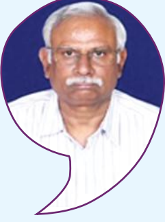
▶ ಶತಿದರ ಎಲೆ ಸಹಕಾರ ಸಂಘಗಳ ಅಪರ ನಿಬಂಧಕರು (ಸಿ)

ಸಿ.ಆರ್.ಎ.ಆರ್.ನ ವಿಸ್ತೃತರೂಪ ವಿವರಿಸುವಂತೆ, ಸಂಸ್ಥೆಯ ಆಸ್ತಿ ಜವಾಬ್ದಾರಿ ತಃಖ್ತೆ (ಅಡಾವೆ ಪತ್ರಿಕೆ) ಯಲ್ಲನ ಅಂಕಿ ಅಂಶಗಳ ಆಧಾರವಾಗಿ, ಅದರ 'ತೊಡಕು ತೂಕ ಆಸ್ತಿಗೆ ಬಂಡವಾಳದ ಅನುಪಾತ'. ಇಲ್ಲಿ ಬಳಸಿರುವ ಪದ ಪುಂಜಗಳ ಅರ್ಥವನ್ನು ತಿಳಿಯಬೇಕು. 'ತೊಡಕು ತೂಕ ಆಸ್ತಿ' ಎಂದರೇನು? (ರಿಸ್ಕ್ ವೈಟೆಡ್ ಅಸೆಟ್). ಸಂಸ್ಥೆಯು ನಡೆಸುವ ಪ್ರತಿ ವ್ಯವಹಾರವೂ ತೊಡಕು (ರಿಸ್ಕ್) ನಿಂದ ಕೂಡಿರುತ್ತದೆ. 'ತೊಡಕು' ಎಂದರೆ ಸಂಭವನೀಯ ನಷ್ಟ. ತೊಡಕಿಲ್ಲದೇ ಯಾವುದೇ ವ್ಯವಹಾರವನ್ನು ಮಾಡಲಾಗುವುದಿಲ್ಲ. ತೊಡಕು ಅನಿವಾರ್ಯ.