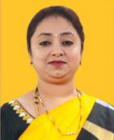
ಶ್ರೀಮತಿ ಪಿ.ಅಶಾಲತಾ ಮುಖ್ಯಾಧಿಕಾರಿಗಳ ಕಾರ್ಯಾಲಯ