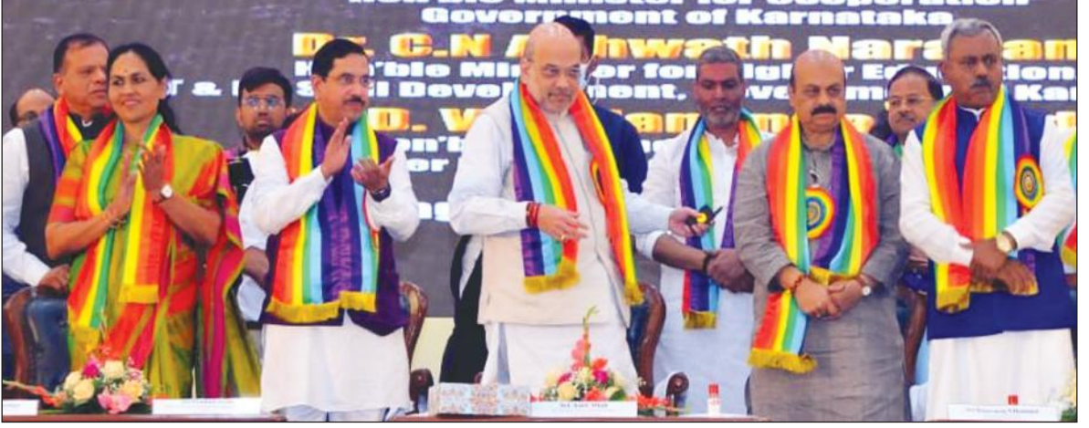
ಸೌಹಾರ್ದ ಸಹಕಾರಿ ಸೌಧವನ್ನು ಕೇಂದ್ರ ಗೃಹ ಮತ್ತು ಸಹಕಾರ ಸಚಿವ ಅಮಿತ್ ಷಾ ಅವರು ವರ್ಚುವಲ್ ಮೂಲಕ ಉದ್ಘಾಟಿಸಿದರು.