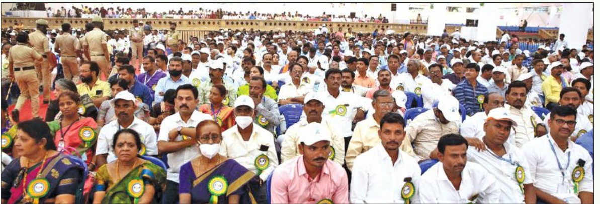
ಸಹಕಾರ ಸಮ್ಮೇಳನ ಕಾರ್ಯಕ್ರಮದಲ್ಲೆ ಭಾಗವಹಿಸಿದ್ದ ಜನಸ್ತೋಮ

ವೇದಿಕೆಯ ಮುಂಭಾಗದಲ್ಲಿ ಶಾಸಕರುಗಳು, ವಿವಿಧ ನಿಗಮ ಮಂಡಳಿಗಳ ಅಧ್ಯಕ್ಷರುಗಳು, ವಿವಿಧ ಸಹಕಾರ ಮಹಾಮಂಡಳಗಳ, ಜಿಲ್ಲಾ ಹಾಲು ಒಕ್ಕೂಟಗಳ, ಡಿಸಿಸಿ ಬ್ಯಾಂಕುಗಳ ಅಧ್ಯಕ್ಷರುಗಳು, ನಿರ್ದೇಶಕರುಗಳು ಸೇರಿದಂತೆ ಅನೇಕ ಸಹಕಾರಿ ಗಣ್ಯರುಗಳು ಆಸೀನರಾಗಿದ್ದರು. ಹತ್ತು ಸಾವಿರಕ್ಕೂ ಹೆಚ್ಚು ಸಹಕಾರಿಗಳು ಭಾಗಿಯಾಗಿದ್ದುದು ದಾಖಲೆಯ ವಿಚಾರ.