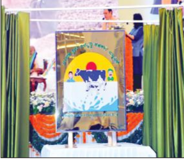
ಕ್ಷೀರ ಸಮೃದ್ಧಿ ಸಹಕಾರಿ ಬ್ಯಾಂಕಿನ ಲಾಂಛನ ಮತ್ತು ಯಶಸ್ವಿನಿ ಯೋಜನೆಯ ಲಾಂಛನವನ್ನು ಕೇಂದ್ರ ಗೃಹ ಮತ್ತು ಸಹಕಾರ ಸಚಿವ ಅಮಿತ್ ಷಾ ಮತ್ತು ಮುಖ್ಯಮಂತ್ರಿ ಬಸವರಾಜ ಬೊಮ್ಮಾಯಿ ಅವರುಗಳು ಲೋಕಾರ್ಪಣೆಗೊಳಿಸಿದರು.