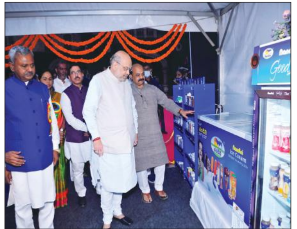
ಕೆ.ಎಂ.ಎಫ್. ಉತ್ಪನ್ನಗಳ ವಿಶ್ಲೇಷಣೆ