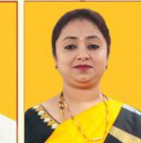
ಶ್ರೀಮತಿ ಪಿ.ಅಶಾಲತಾ ಮುಖ್ಯಸ್ಥಾಧಿಕಾರಿಗಳ ಕಛೇರಿ