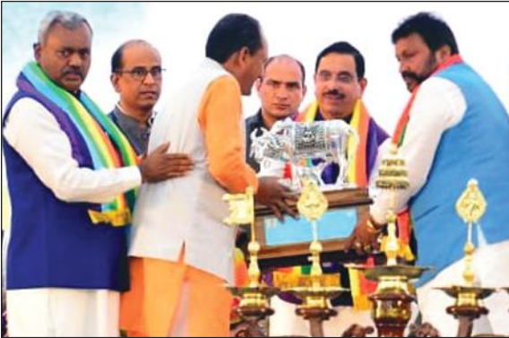
ಕೇಂದ್ರ ಸಂಸದೀಯ ವ್ಯವಹಾರಗಳ ಸಚಿವ ಪ್ರಲ್ಹಾದ್ ಜೋಷಿ ಅವರಿಗೆ ಸಚಿವರುಗಳು ಹಸು ಮತ್ತು ಕರುವಿನ ಬೆಳ್ಳಿಯ ವಿಗ್ರಹವನ್ನು ನೀಡಿ ಗೌರವಿಸಿದರು.