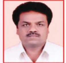
ಶ್ರೀ ಎ. ಐ. ಉತ್ತರ ನಿರ್ದೇಶಕರು