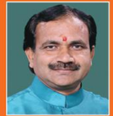
ಭಗವಂತ್ ಖುಬಾ ಹೊಸ ಮತ್ತು ನವೀಕರಿಸಬಹುದಾದ ಇಂಧನ, ರಾಸಾಯನಿಕ ಮತ್ತು ರಸಗೊಬ್ಬರ ಸಚಿವರು