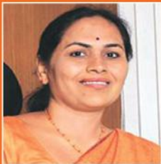
ಶೋಭಾ ಕರಂದ್ಲಾಜೆ ಕೃಷಿ ಮತ್ತು ರೈತರ ಅಭಿವೃದ್ಧಿ ಸಚಿವರು