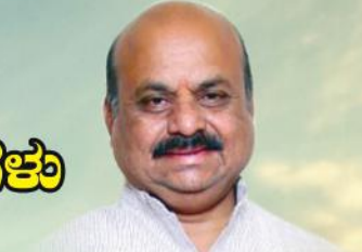
ಶ್ರೀ ಬಸವರಾಜ ಬೊಮ್ಮಾಯಿ ಮಾನ್ಯ ಮುಖ್ಯಮಂತ್ರಿಗಳು ಕರ್ನಾಟಕ ಸರ್ಕಾರ