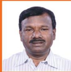
ಎ. ನಾರಾಯಣಸ್ವಾಮಿ ಸಾಮಾಜಿಕ ನ್ಯಾಯ ಮತ್ತು ಸಬಲೀಕರಣ ಸಚಿವರು