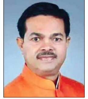
ಬಿ.ಎಲ್. ವರ್ಮಾ ಸಹಾಯಕ ಸಚಿವರು

ವಿಶೇಷವಾಗಿ ಕೇಂದ್ರ ಸರ್ಕಾರವು ಕೃಷಿ ಖಾತೆಯ ಜೊತೆಗಿದ್ದ ಸಹಕಾರ ಖಾತೆಯನ್ನು ಪ್ರತ್ಯೇಕಿಸಿದ್ದಾರೆ. ಕೇಂದ್ರ ಗೃಹ ಸಚಿವ ಅಮಿತ್ ಶಾ ಅವರಿಗೆ ಹೆಚ್ಚುವರಿ ಜವಾಬ್ದಾರಿ ನೀಡಿರುವ ಪ್ರಧಾನಿ ಮೋದಿ ಅವರು 'ಸಹಕಾರ' ಸಚಿವಾಲಯವನ್ನು ಪ್ರತ್ಯೇಕಿಸಿದ್ದಾರೆ. ಅಮಿತ್ ಶಾ ಅವರು ಸಹಕಾರ ಸಚಿವರಾಗಿಯೂ ಕಾರ್ಯನಿರ್ವಹಿಸುತ್ತಿದ್ದಾರೆ.