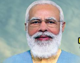
ಶ್ರೀ ನರೇಂದ್ರ ಮೋದಿ ಸನ್ಮಾನ್ಯ ಪ್ರಧಾನ ಮಂತ್ರಿಗಳು ಭಾರತ ಸರ್ಕಾರ