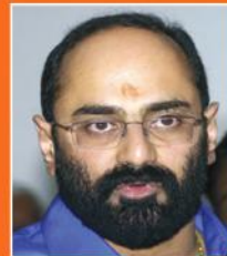
ರಾಜೀವ್ ಚಂದ್ರಶೇಖರ್ ಕೌಶಲ ಅಭಿವೃದ್ಧಿ ಮತ್ತು ಉದ್ಯಮತೀಲತೆ, ಎಲೆಕ್ಟ್ರಾನಿಕ್ಸ್ ಮತ್ತು ಮಾಹಿತಿ ತಂತ್ರಜ್ಞಾನ ಸಚಿವರು