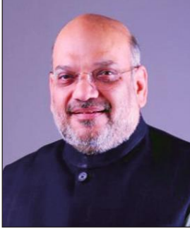
ಅಮಿತ್ ಶಾ ಕೇಂದ್ರದ ಸಹಕಾರಿ ಸಚಿವರು

ನವದೆಹಲಿ : ಪ್ರಧಾನಿ ನರೇಂದ್ರ ಮೋದಿ ಅವರು ಕಳೆದ ಮಾಹೆಯಲ್ಲಿ ಸಂಪುಟ ವಿಸ್ತರಣೆ ಮಾಡಿದ್ದು ರಾಜ್ಯದ ಸಂಸದರಾದ ಶೋಭಾ ಕರಂದ್ಲಾಜೆ, ಎ.ನಾರಾಯಣಸ್ವಾಮಿ, ಭಗವಂತ ಖುಬಾ ಮತ್ತು ರಾಜ್ಯಸಭಾ ಸದಸ್ಯ ರಾಜೀವ್ ಚಂದ್ರಶೇಖರ್ ಅವರುಗಳನ್ನು ಸಂಪುಟಕ್ಕೆ ಸೇರ್ಪಡೆ ಮಾಡಿದ್ದಾರೆ.